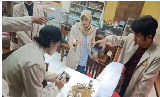
Gambar 2. Pelatihan Foto Produk

Terakhir adalah pelatihan foto produk menggunakan handphone. Dalam kegiatan tersebut, tim tidak hanya memberikan teori terkait fotografi dan edukasi terkait packaging tetapi juga mengajak peserta untuk berpartisipasi secara aktif berbagi pengalaman, dan mempraktekkan cara mengambil foto yang menarik dan mengemasnya secara kreatif mungkin untuk nantinya di unggah ke medsos maupun e-commerce. Bahkan beberapa peserta bersedia menjadi model pada saat kegiatan foto produk berlangsung. Tujuan kegiatan foto produk agar pengelola dan pekerja secara aktif memberikan informasi secara visual kepada konsumen melalui jejaring digital. Sehingga nantinya dapat meningkatkan engagement akibat promosi yang dilakukan secara terus menerus dengan tampilan yang menarik.