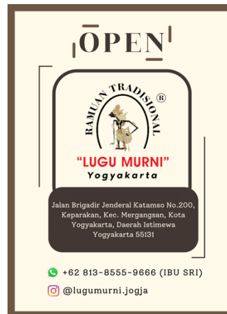
Gambar 1. Logo Jamu

2013). Sehingga dalam pemilihan warna tidak dapat dilakukan secara sembarangan karena memiliki makna sebagai penggambaran filosofi produk.