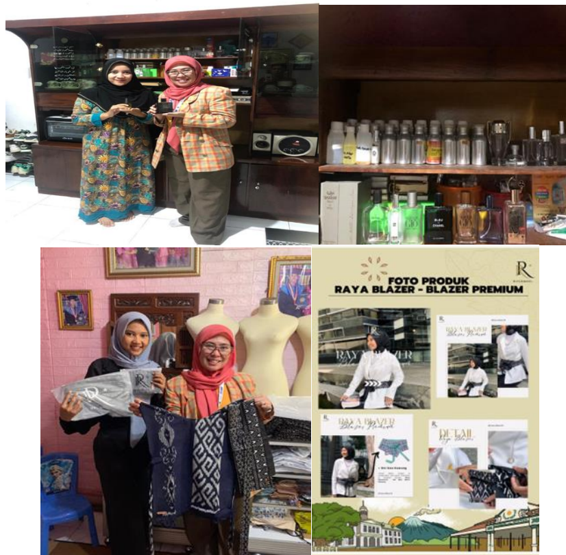
Gambar 4. Pendampingan Lapangan Peserta TKMP