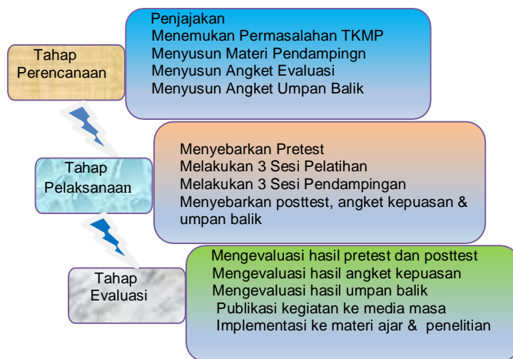
Gambar 1. Tahapan Pengabdian kepada Masyarakat

Dalam penerapan learning service method , tahapan pertama yang dilakukan adalah tahap persiapan. Pada fase ini, dilakukan identifikasi awal dengan menghubungi peserta program TKMP yang menjalankan usahanya di wilayah Jakarta Selatan. Melalui proses penjajakan tersebut, diperoleh gambaran mengenai kondisi peserta TKMP saat ini beserta tantangan yang dihadapi dalam menjalankan aktivitas usaha. Berdasarkan hasil penjajakan tersebut, tim dosen menyusun proposal kegiatan serta merancang materi pelatihan dan pendampingan yang relevan. Selain itu, disiapkan pula instrumen evaluasi berupa angket pretest dan posttest , serta kuesioner kepuasan dan umpan balik peserta, yang akan digunakan untuk menilai efektivitas program pada akhir kegiatan.