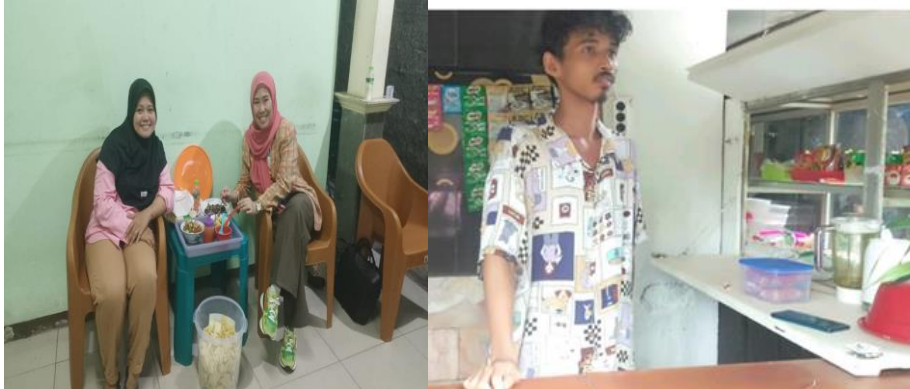
Gambar 3. Pendampingan Lapangan Peserta TKMP

Pengeluaran kas adalah pengeluaran tunai untuk kegiatan operasional perusahaan, adanya pengeluaran kas guna untuk mendukung kegiatan yang ada di perusahaan serta menunjang keperluan atau yang dibutuhkan perusahaan. Laporan laba rugi adalah bagian dari laporan keuangan suatu perusahaan yang disajikan pada suatu periode akuntansi yang menjabarkan unsur-unsur pendapatan dan beban perusahaan sehingga menghasilkan suatu laba bersih. Pencatatan atau pembukuan dilakukan setiap hari, karena usaha kuliner memiliki transaksi yang banyak dari hasil penjualan.